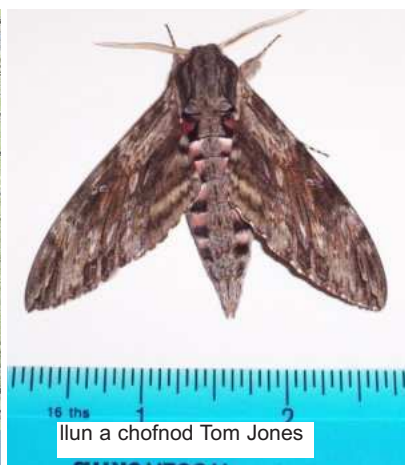
llun a chofnod Tom Jones

yn 2005. Blynyddoedd y cofnodion eraill oedd 1992 (1), 1999 (1), 2005 (1), 2008, 2009 (3), 2011 (1)