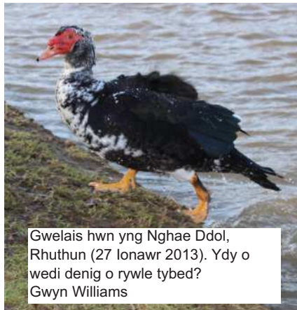
Gwelais hwn yng Nghae Ddol, Rhuthun (27 Ionawr 2013). Ydy o wedi denig o rywle tybed? Gwyn Williams

The Muscovy Duck (Cairina moschata) is a large duck native to Mexico, Central, and South America. Feral Muscovy Ducks have been reported in parts of Europe.