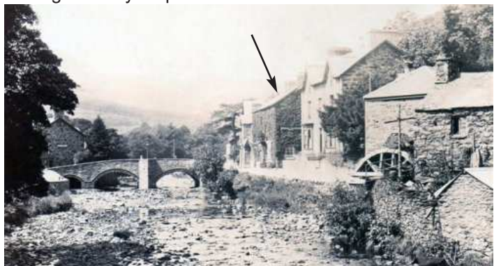
Pont Beddgelert yn y dauddegau ugain mynedd cyn trawiad taranfollt i'r gwesty ar y dde