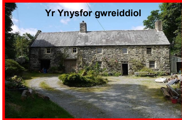
Yr Ynysfor gwreiddiol

Llyn Glaslyn yw tarddle Afon Glaslyn cyn llyfo drwy Lynnoedd Gwynant a Dinas, heibio Beddgelert a Phont Aberglaslyn. Codwyd ffermdy gwreiddiol Ynysfor (a welir ar y dde) tua 1700. Ehangwyd yn ystod y bedwaredd ganrif ar bymtheg ac yna codwyd plasdy newydd tua diwedd y ganrif honno (isod). Wedyn, defnyddiwyd yr hen ffermdy ar gyfer y gweision a'r morwynion.