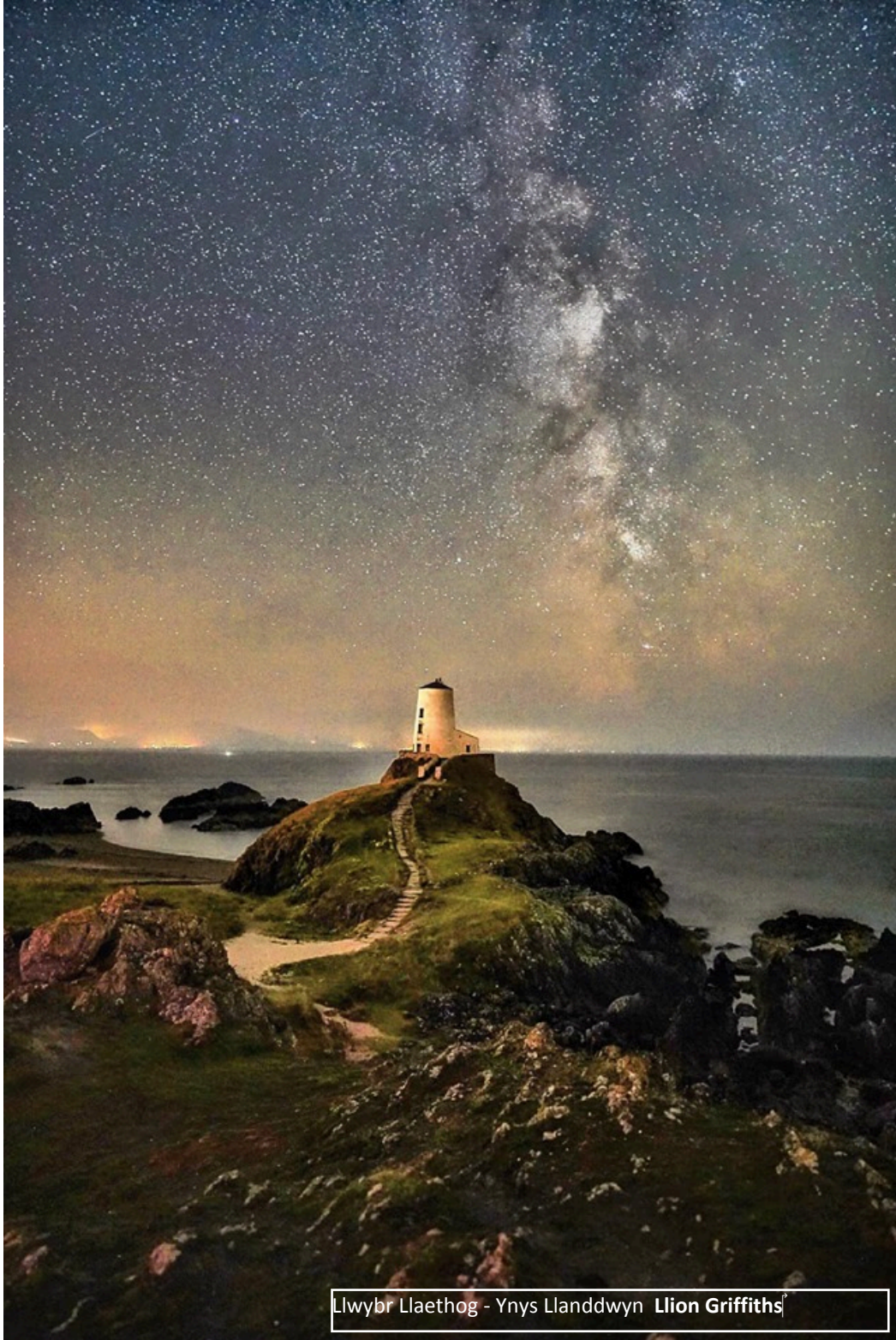
Llwybr Llaethog - Ynys Llanddwyn Llion Griffiths

gan gynnwys Y Bwrdd Natur, adnodd i athrawon a rhieni