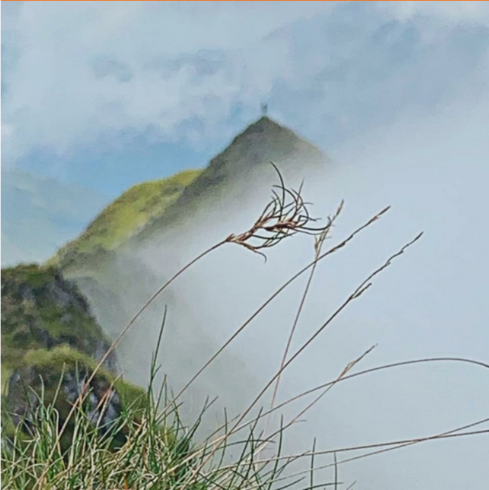
Festuca vivipara (Yr Wyddfa) Bwlch Main yn gefndir.