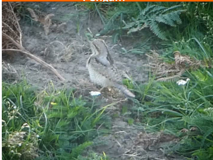
Pengam yn Aberogwr