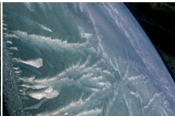
Waunfawr (ffenest car) Nadolig 2009 Duncan Brown