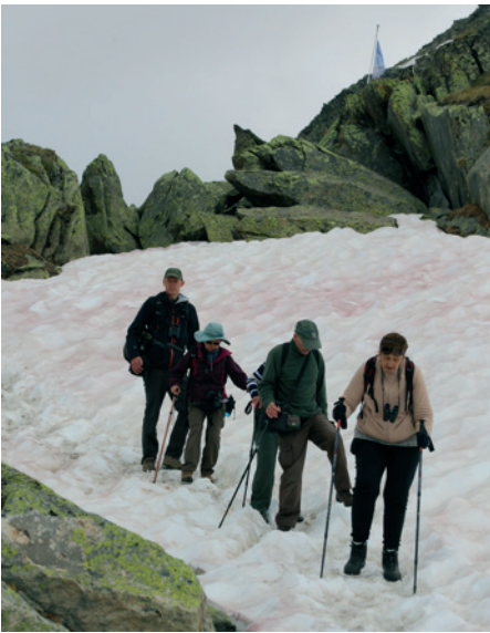
Ilun arall o eira pinc, Bettmeralp, Mehefin 2018