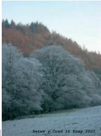
Betws y Coed, 26 Rhagfyr 2007 Duncan Brown

Mae pawb yn tynnu lluniau o hyn. BETH AM EU CASGLU AT EI GILYDD - ewch yn ôl yn archif eich albwm personol - o luniau eich plentyndod i'r rhai diweddaraf. Cofiwch ddweud PRYD a LLE.... a dyma'r amser i ddechrau sylwi ar rai newydd.