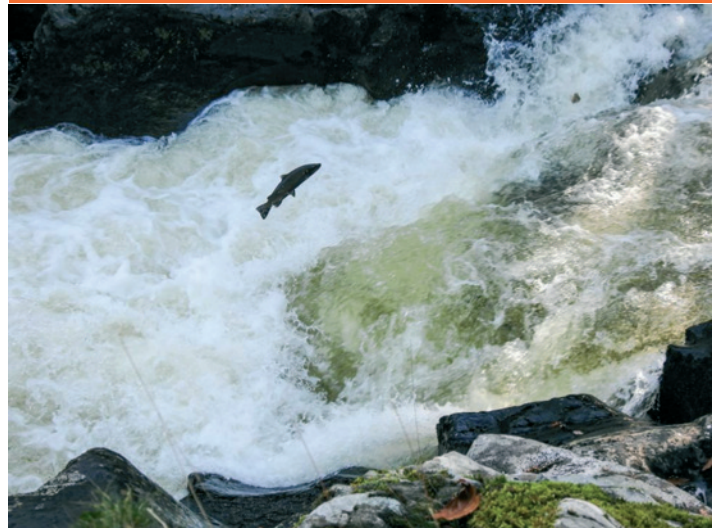
Eogiaid yn nofio fyny rhaeadr bach ar afon Lledr ger Betws y coed 16 Hydref 2019 o'na lwyth yn trio mynd fyny, werth ei weld. Gerallt Roberts

10 Medi 1883 Dolgellau Rain again in the night and early this morning ...drove in the coach to Dolgellay ... took a car from there and drove to the New Bridge. ...I did not rise a fish all day, but I saw several salmon jumping. I also tried minnow. Dyddiadur Hela CEM Edwards