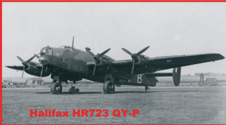
Halifax HR723 QY-P

Mae'r hanes yma yn dilyn cais ym Mwletin Hydref am wybodaeth am ddamweiniau awyrennau lleol yn y Gogledd.