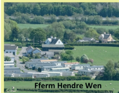
Fferm Hendre Wen