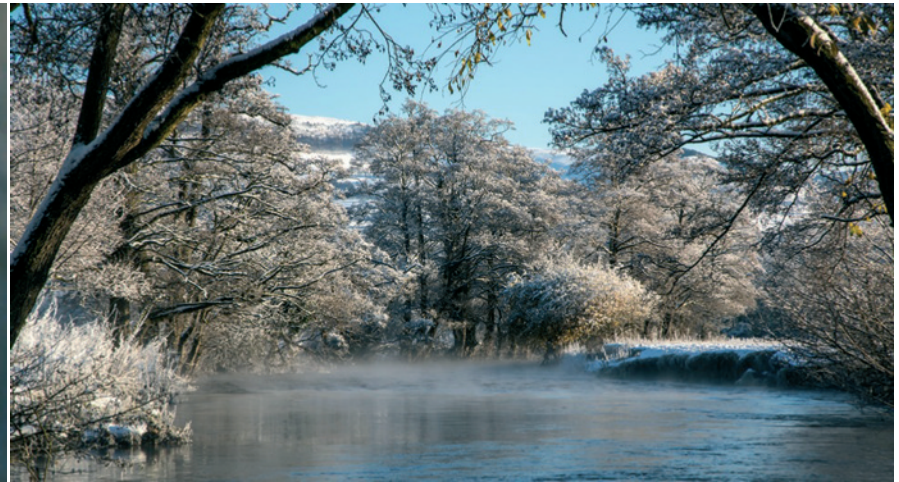
Afon Clwyd rhwng Dinbych a Llandyrnog, Rhagfyr 11, 2017 Alun Williams