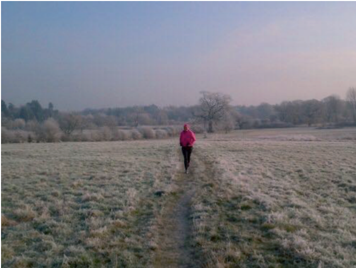
Solihull c15 Rhagfyr 2012. Sue Lindsay