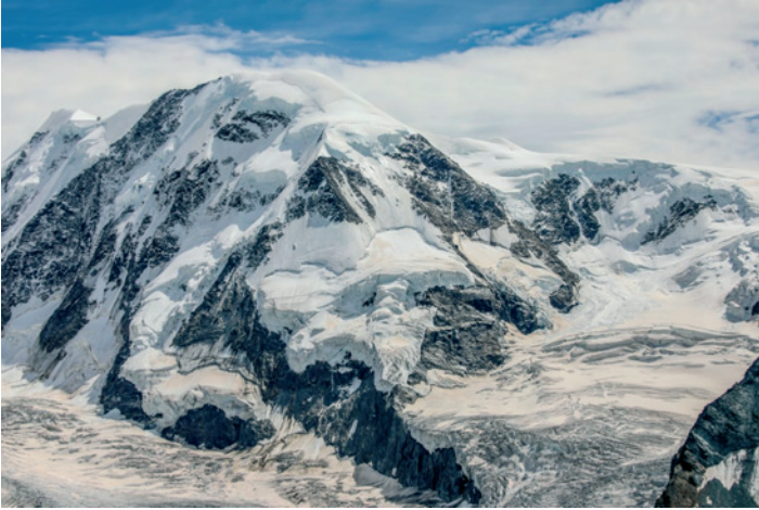
Sylwer ar yr "eira coch" (pinc !) ar lethrau Liskamm 17 Awst 2019. Chlamydomonas nivalis Iolo ap Gwyn