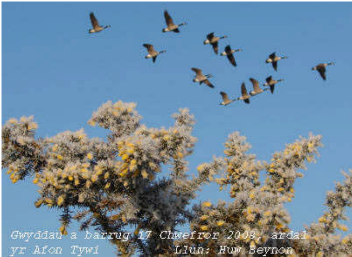
Gwyddau a barrug 17 Chwefror 2008, ardal yr Afon Tywi

Golygydd: Duncan Brown, Cysodi: Ifor Williams, ychwanegwch ddeunydd i - llennatur@yahoo.co.uk