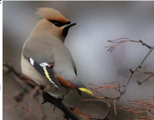
Cynffon Sidan "Cennad y Chwldro?" Llundun Dewi Edwards, Dinbych 14 Rhagfyr 2010