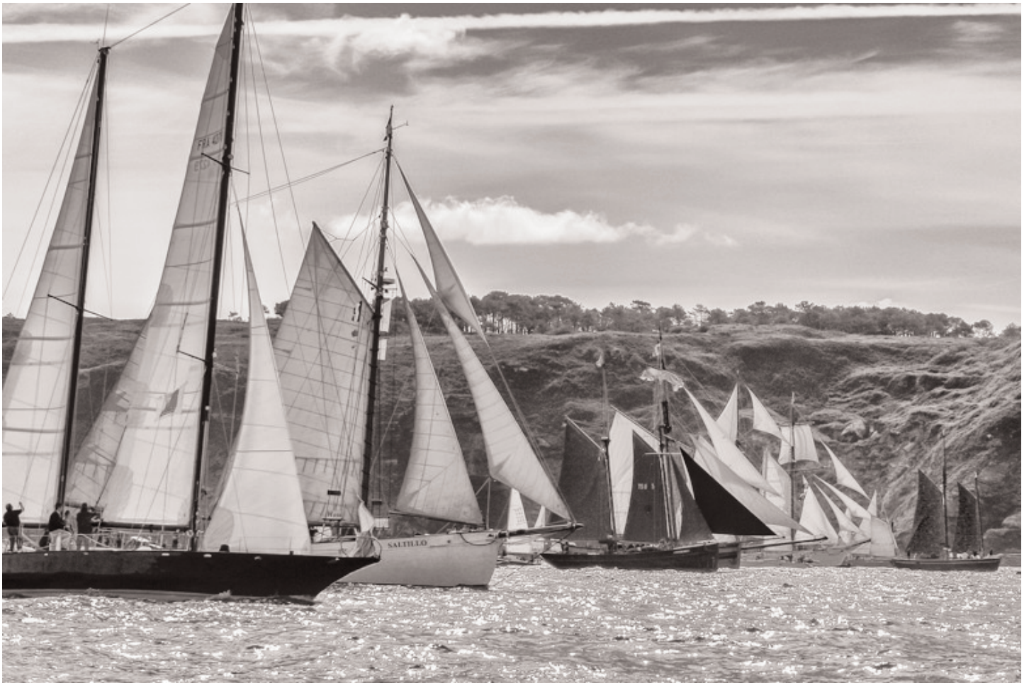
Image prise le 19 Juillet 2008 lors de la route faite vers Douarnenez. Ici nous sommes à l'ouest de la rade de Brest, au fond la presqu'île de Crozon, on va virer à la Pointe des Espagnols (qui ferme la partie sud de la rade)

Depuis 1992, tous les quatre ans, Brest est le lieu d'une fête maritime que l'on peut qualifier de grandiose. Pendant une semaine s'y donnent rendez-vous des voiliers venant du monde entier, voiliers-écoles, voiliers historiques, orgueil de différentes marines... Depuis les plus grands quatre-mâts tels le Sedow ukrainien, le Kruzenstein russe qui font plus de 110 mètre chacun jusqu'aux plus modestes. Bref, plus de 3000 bateaux (oui, trois mille) alignés sur les quais, voguant sur la rade... Vraiment la fête qui attire près de deux millions de touristes. Vers la fin du séjour toute cette armada appareille et met le cap sur Douarnenez. Vu de terre ou mieux depuis un autre bateau, le spectacle est époustoufflant.