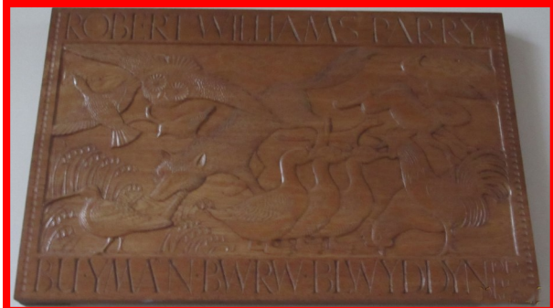
Y plac yn Ysgol y Sarnau i gofio cyfnod R. Williams Parry yn Brifathro.